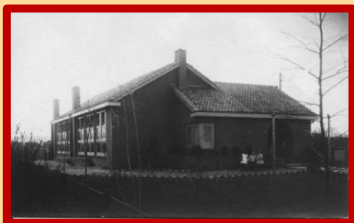
Christelijke kleuterschool 'Kindertuin' aan de Daalseweg.

Toch moeten we u deelgenoot maken van een aantal bijzondere stukken. Zo kregen we prachtige foto's van het in- en exterieur van 'Kindertuin Zuylen', de christelijk kleuterschool aan de Daalseweg.