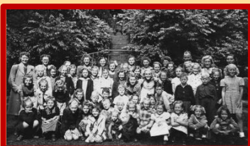
Kinderen van de Culturele Ontspannings Vereniging 't Zand 'op stap'

Omdat we aardig tegen de vakantie aanlopen is de foto die mevrouw van Dam-de Jongh bracht ook heel actueel: de kinderen van de C.O.V. 't Zand tijdens hun dagje uit, vermoedelijk in 1946 of '47.