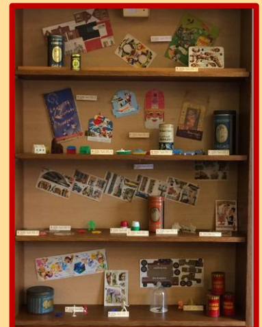
Kast met 'Snoepjes van de Week' van De Gruyter

in Zuilen. De eerste kasten zijn ingericht, binnenkort hoort u meer.