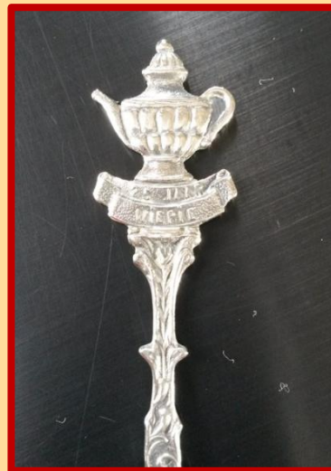
25 jaar 'WIEPIE' en geen 'TJEPPIE'

Maar het lepeltje is een bewijs van het verhaal, dat maakt het zo bijzonder.