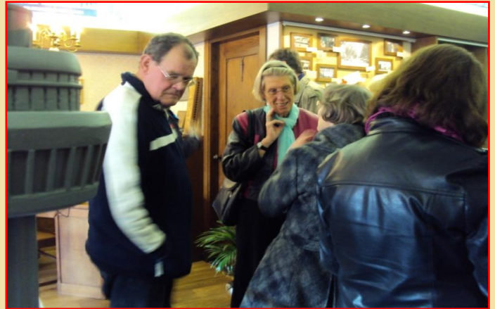
Geanimeerde gesprekken tijdens StraatReünie Prinses Beatrixlaan.

Ook veel anderen brachten nieuwe aanwinsten mee. Zoveel inbreng op één dag hebben we nog niet eerder gekregen. Hartelijk dank aan alle gevers.