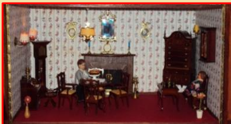
Kijkje in de huiskamer van het poppenhuis.