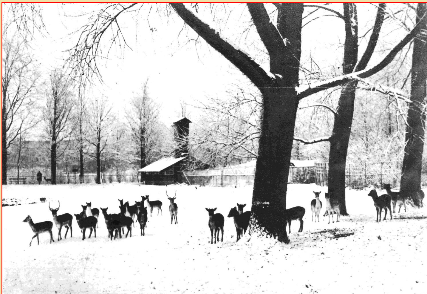
HERTENKAMP VAN HET JULIANAPARK OMSTREEKS 1930

HIERBIJ DE AFBEELDING VAN DE KERSTKAART 2010, WAARBIJ WIJ GRAAG EXTRA WILLEN ONDERSTREPEN DAT WE U HET KOMENDE JAAR VEEL GEZONDHEID TOEWENSEN.