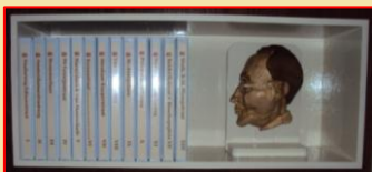
O. Norbruis heeft er de bril maar bij opgezet.

Van 14 tot 17 uur is in het Museum van Zuilen de StraatReünie voor de huidige en vorige bewoners van deze straten. U kunt dan ook een boekje kopen met alle tot nu toe bekende wetenswaardigheden. U leest het al: 'Tot nu toe bekende', dus als u úw (mooiste) herinnering aan de Wattlaan, Fultonstraat en Siemensstraat ons wilt toesturen: heel graag! Schrijf op waarom u trots bent (was) op uw straat. Zo wordt het verhaal over de straat compleet. Bij voorbaat dank!