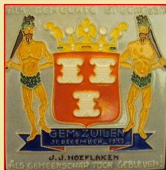
Dit is de achtste met naam, nog maar 192 dus.