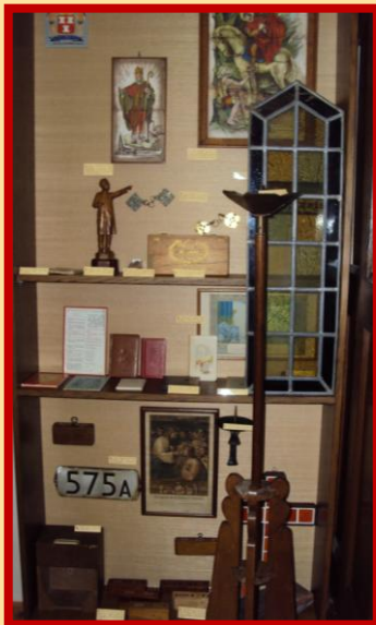
De kast met St.-Ludgeruskerk is gereed.

kasten een stukje van de – natuurlijk Zuilense – geschiedenis van de Amsterdamsestraatweg in beeld gaan brengen. De kast naast de biechtstoel werd ingericht met, hoe kan het ook anders, de St.-Ludgeruskerk.