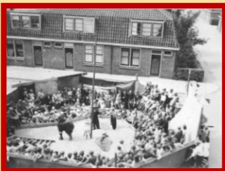
Op het Dr. Schaepmanplein vermaken de kinderen van de Julianabouw het publiek en zichzelf met een prachtig circus.

Al vele jaren waren we op zoek naar leuke foto's van de festiviteiten die georganiseerd werden door buurtvereniging 'Prinses Juliana'. Tijdens de StraatReünie van de Jan Overdijkstraat kregen we een prachtige serie, met vooral het kindercircus.