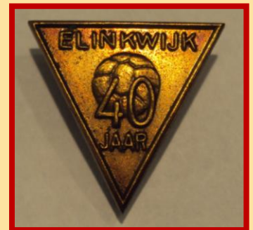
Reverspeldje 40 jaar Elinkwijk

Dáár zijn we blij mee! Een van de bezoekers, de heer P. S. bracht voor de collectie een speldje mee. Een leuke aanwinst: het is een reverspeldje dat werd uitgegeven naar aanleiding van het 40-jarig bestaan van voetbalvereniging 'Elinkwijk' in 1959. Die hadden we nog niet! Dus... hartelijk dank!