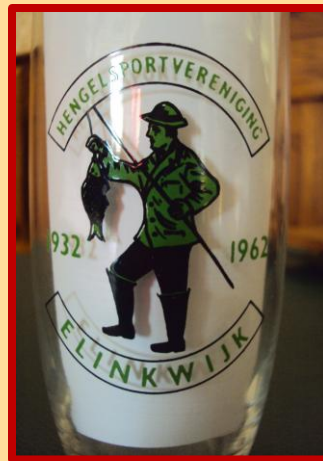
Zonder woorden, maar met veel dank!

mevrouw M. Een lied n.a.v. de Bevrijding, het boekje Zuilen Eert zijn Gevallen , prachtige plattegrond van Utrecht en 'Nieuw-Zuilen' uit 1933, en... een longdrinkglas dat we nog niet hadden.