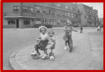
Spelende kinderen op de stoep van de Ampèrestraat hoek Galvanistraat

Deze keer weet ik bijna niet waar te beginnen. Er kwam namelijk heel veel bijzonders binnen. Het begint 'natuurlijk' met mooie foto's van een bijna onherkenbare Ampèrestraat.