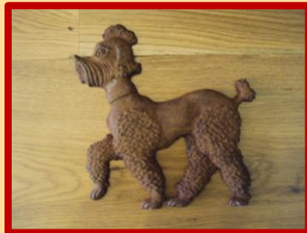
De Koningspoedel, leuke aanwinst voor de collectie!

oproep) heeft ook succes gehad. We kregen vele artikelen van Werkspoor erbij, onder andere de Zeemeermin! H. Hogenberg bracht nog vier stukken van de Gieterij, waarbij drie varianten die we nog niet hadden!