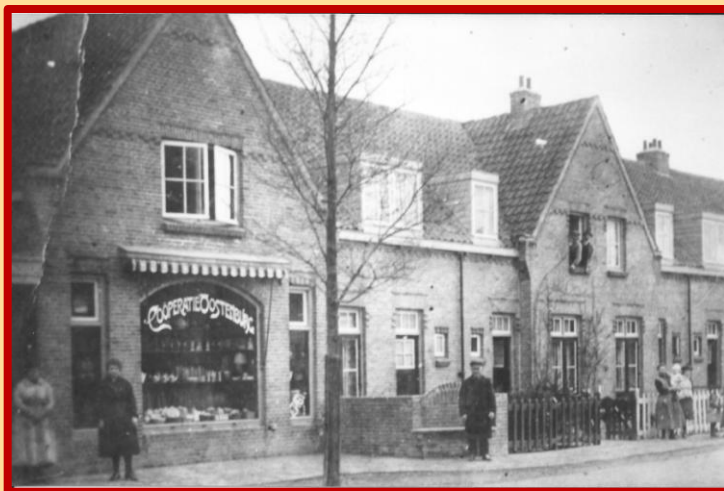
De Galvanistraat op de hoek van de De Lessepsstraat