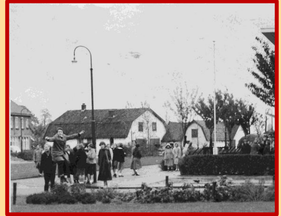
Schoolkinderen in de Prinses Irenelaan

Straten en pleinen mochten in de oorlog niet vernoemd zijn naar levende leden van het Koninklijk Huis. De Prinses Irenelaan liep dwars op de Prinses Beatrixlaan, die al vóór de vernoeming 'Hovenierslaan' genoemd werd. Dus was de keuze gauw gemaakt. Maar na de oorlog werd het weer heel snel Prinses Irenelaan natuurlijk. We hebben nog meer te vertellen over de Prinses Irenelaan, dus: welkom aan alle (oud)-bewoners en andere geïnteresseerden!