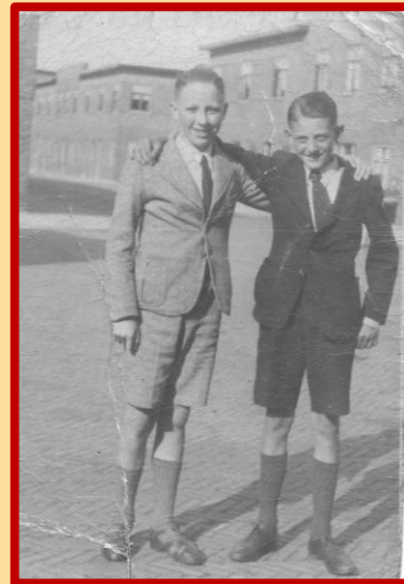
Vriendjes in de Koppesokstraat

Op Wikipedia lezen we: 'Jan Pieterszoon Koppesok was een veerman die in de zestiende eeuw werkzaam was bij Brielle. In 1572 wilden de Watergeuzen slag leveren met de Spaanse vloot, maar daar er geen schepen waren besloten ze een stad in te nemen, voornamelijk met het doel om deze te plunderen. Naar verluidt zou Jan Koppesok in 1572 aan een van de aanvoerders der Watergeuzen, Willem Bloys van Treslong, hebben meegedeeld dat er zich in Brielle geen Spaans garnizoen bevond. Daarop werd Koppesok gevraagd om aan de burgemeester te verzoeken de stad over te geven. Hij beweerde dat er 5000 geuzen voor de stad lagen, maar het waren er veel minder. De burgemeester weigerde, waarop de opperbevelhebber der geuzen, Lumey, de stad voor zich opeiste en de Noordpoort belegerde. Een aantal mensen kon langs de Zuidpoort wegvlugten, maar toen het ultimatum verstreken was, werd uiteindelijk ook de Zuidpoort bestormd. De stad werd geplunderd en er werden diverse wrede daden begaan, waaronder de moord op de martelaren van Gorcum...' Over de straat zelf vertellen we u van alles tijdens de StraatReünie.