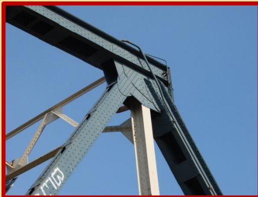
Verkeersbrug bij Zaltbommel.

Daarom is het bijzonder leuk dat het gelukt is een stuk van deze geschiedenis onder de aandacht te brengen van een groot publiek. Enige jaren geleden kwam een Sik – een bij Werkspoor gebouwde locomotor – bij Station Utrecht-Zuilen, als eerbetoon aan de mannen die treinen bouwden bij Werkspoor. Maar er was nog niets tastbaars van de vele bruggen die Werkspoor bouwde. En de fabriek bouwde juist zoveel bruggen. Een van de bekendste is wel de Verkeersbrug bij Zaltbommel.