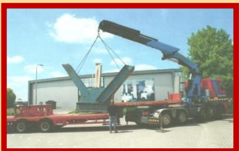
Onderweg naar Zuilen

Nadat ook deze hobbel genomen was, kon het stuk naar Utrecht komen. Het werd opgeslagen in afwachting van de dingen die zouden komen.