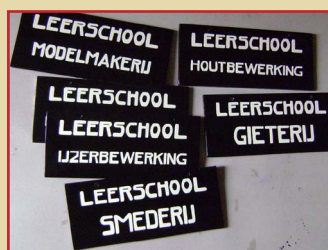
Zoals een echte kunstschilder betaamt: prachtige replica's van de bordjes!

Het Museum van Zuilen ijvert al lange tijd voor het bijeen krijgen van een behoorlijke verscheidenheid van zulke werkstukken. In de loop der tijd zijn er al veel verschillende gebracht (of toegezegd en die komen vermoedelijk binnenkort de collectie verrijken). Deze combinatie maakt het nu mogelijk een aparte kast in te