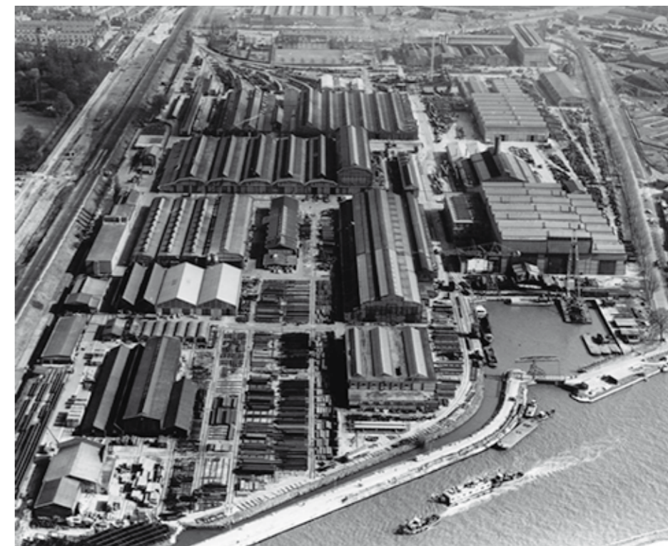
Luchtfoto gebied Werkspoorkwartier 1964