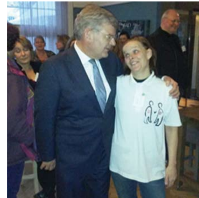
Burgemeester Jan van Zanen met Monique Jansen

Sinds 2010 is Buren voor Buren, de vlag waaronder de vrijwilligers van het vreedzaam Plein 11 opereren, actief voor het bevorderen van het welzijn van bewoners in de wijk Zuilen. Voornamelijk voor degenen die tegen of onder het bestaansminimum en/of bijstandsniveau leven. Buiten het feit dat de stichting bewoners aan huisraad helpt, organiseren ze ook veel verschillende activiteiten zoals een inloopochtend, diverse cursussen, gezelligheidsclubs en spelletjesavonden. Veel bewoners van Zuilen vinden inmiddels hun weg naar de stichting toe om aan een activiteit deel te nemen of om er zelf één te organiseren. Zuilen is een fijne buurt om te wonen en met elkaar kunnen we het tot een bruisend buurt maken waar bewoners elkaar kunnen ontmoeten, van gedachten wisselen en elkaars interesses kunnen delen. Hebt u thuis overvol huisraad liggen wat nog schoon en bruikbaar is, breng het naar Buren voor Buren en u maakt uw medebewoner er erg blij mee, alles is welkom op kleding na. Wilt u op de hoogte blijven, volg ons dan op Twitter of op Facebook. U vindt ons op de Elsenburglaan 10, 3555 XJ te Utrecht. Wij zijn geopend op maandag, woensdag en vrijdag van 12.00 tot 16.00 uur en op dinsdag en donderdag van 10.00 tot 16.00 uur. Zaterdag en zondag zijn wij gesloten.