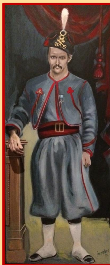
Een eerder door Peeters vervaardigde 'deurschildering' in het Museum van Zuilen

De plattegrond wordt nog dagelijks gevuld, en er komen (daar ben ik soms een beetje debet aan) ook nog weer nieuwe items bij, die bij de geschiedenis van Zuilen niet mogen ontbreken.