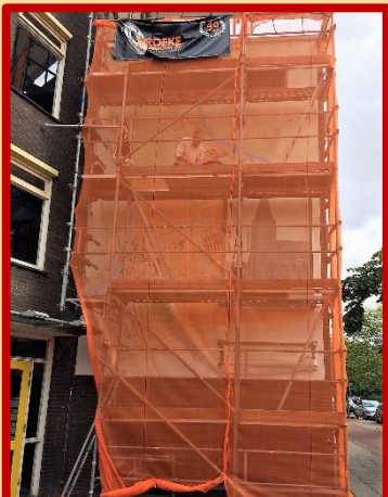
De steiger staat, de eerste streken zijn gezet...