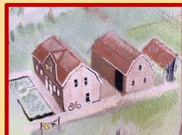
De woning van Michel Stolker aan de Daalseweg (Mies is thuis zo te zien)

Wat krijgen we straks allemaal te zien? Een paar tijpjes van de sluier mag ik alvast verklappen: