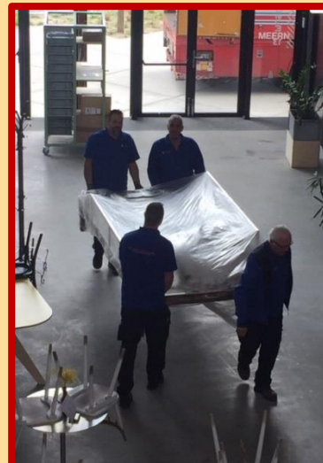
Door de deur van de Schaverijstraat 13 is ook gelukt. (was wel handig dat er handvatten aan de rand gemaakt zijn, op de vier hoeken kon zo mooi iedereen op afstand blijven). Maar hij past niet in de lift. Dat wisten ze wel hoor, 'Geen probleem, dat komt wel goed hoor', even in de handen spugen (nee, nee, dat mag al helemaal niet in deze tijden, foei!) en daar gaan ze...