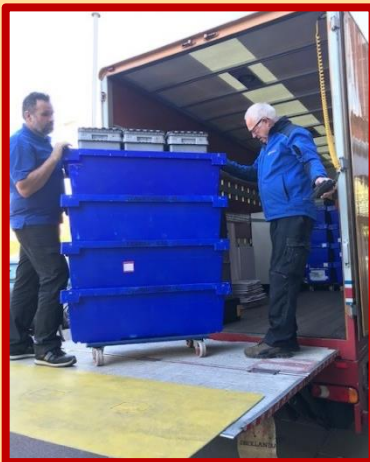
Bakken vol materiaal, mappen, stoelen, banken, houten replica's, alles ging op reis.