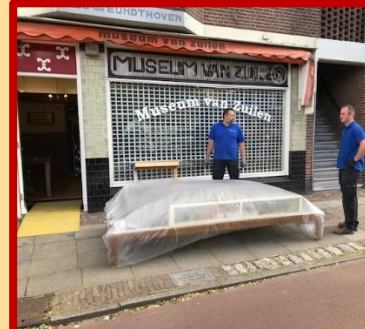
Naar buiten is gelukt. Dat was het makkelijke gedeelte!