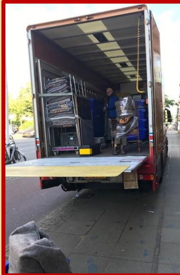
Langzaam maar zeker vult de eerste verhuswagen zich met de collectie.

Met zoveel vakmanschap en plezier in het werk, zouden we wel elke dag willen verhuizen. Hartelijk dank!