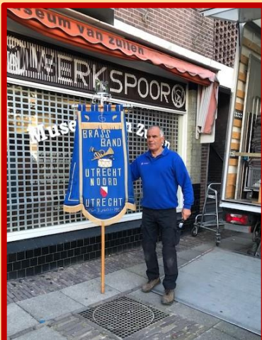
Één van de verhuizers vertelde bij de Brass Band Utrecht Noord te hebben gespeeld. Hij vond het een eer om het vaandel te mogen overbrengen.

Nadat de collectie was overgebracht naar het depot bij de nieuwe locatie kwam de grootste klus van de dag. Letterlijk en figuurlijk. De Werkspoorafel moest natuurlijk mee. Hij krijgt ook op de Schaverijstraat een bijzondere plek. Maar... om daar te komen had nog wel een paar voeten in de aarde.