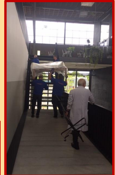
Dan is de tweede trap blijkbaar een makkie: de man links onder tilt met één hand mee, en maakt een foto met het toestel in zijn rechterhand. (Leuk voor later!)