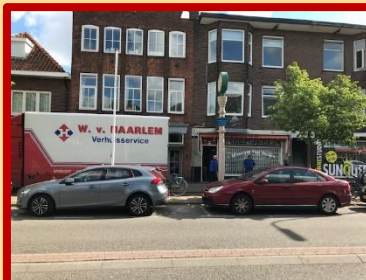
Beetje reclame voor de verhuizers mag natuurlijk niet ontbreken.