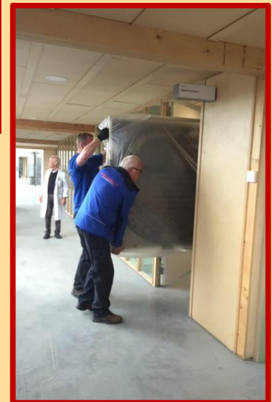
En met wat passen en meten is ook de ingang van het museum gepasseerd. De tafel staat op zijn nieuwe plek. Mooier dan ooit. Het verhuizen is klaar. We kunnen gaan inrichten....