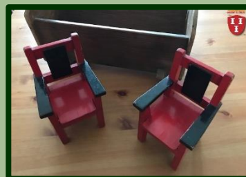
Gebracht door A. Drijver: poppenstoeltjes, rood-zwart geverfd, beetje 'Rietveld-achtig' model.

Poppenwiegje, poppenbedje, pakhuizen, kinderfornuisje, we hebben al verschillende stukken in de collectie (maar vrijwel uitsluitend allemaal de cadeautjes voor meisjes...)