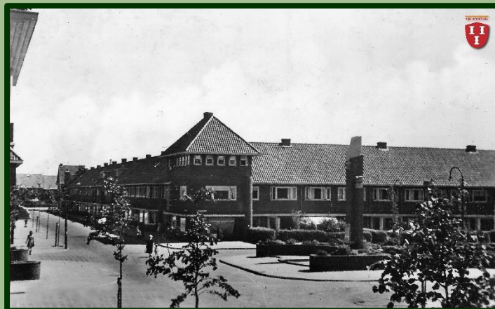
Wethouder D.M. Plompstraat met het Vliegermonument.

U kunt zich ook telefonisch aanmelden op nummer 06 81036662. In een tijdsblok van 1,5 uur kunnen we maximaal 40 mensen plaatsen.