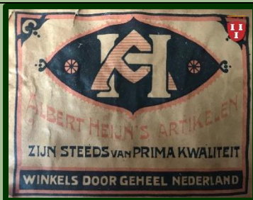
Etiket van het overpak lucifers met een opvallend logo van Albert Heijn.