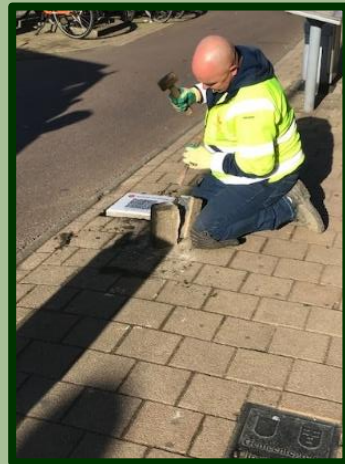
Het leggen van de qr-tegel bij de grens Utrecht-Zuilen.

26 Op de Amsterdamsestraatweg werden 5 stoeptegels met een qr-code gelegd. Deze vormen een wandeling van de grens met Utrecht en de grens met Maarssen en weer terug. Teksten van het Museum van Zuilen.