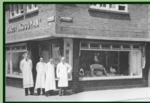
Slagerij Kooijman hoek Hanrathstraat

Het Museum van Zuilen is dus dicht en dan zou je kunnen denken dat we de hele dag met de armen over elkaar zitten te wachten tot 'het' over is. Dat is niet het geval. Om u een indruk te geven plaats ik op de volgende pagina het 'Jaarverslag' tot nu toe, zoals we dat jaarlijks bijhouden.