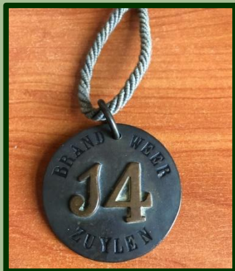
Vermoedelijk staat de 'J' voor Jeugd bij de Vrijwillige Brandweer 'Zuylen'.

Niet eerder gezien, reacties tot nu opperen de mogelijkheid dat het gaat om een 'aanwezigheidspenning'. Zo wist de commandant wie er bij een brand aanwezig waren en was de terugkeer van de manschappen eenvoudig te controleren.