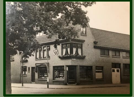
De winkel van Amsing, hoek Edisonstraat

Deze straat werd genoemd naar André Marie Ampère (1775-1836). Volgens de overlevering ging Ampère nooit naar school en leidde hij zijn studie vooral zelf, las bij wijze van ontspanning stukken uit L'Encyclopédie. Voor de proeven die hij deed, was het noodzakelijk dat hij precies de grootte van de elektrische stroom kon meten. Hij ontwikkelde daarvoor een zeer nauwkeurig instrument: de ampèremeter.