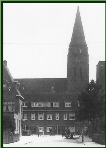
Zicht op de eerste (oneven) nummers van de Ampèrestraat, met daarachter nog de St.-Ludgeruskerk.

We gaan rechtsom, maar de eerste woningen aan de linker- en rechterkant zijn nog van de Galvanistraat. Pas in (en links dus óm) de hoek staan de eerste woningen met de Ampèrestraat als adres. In de stratengids die we voor onze wandeling van omstreeks 1938 hanteren, staat in de hele Ampèrestraat slechts één winkeladres. Dat lijkt van geen kanten te kloppen, maar is wel waar. Het komt omdat 'de winkel op de hoek' dikwijls een ander postadres heeft dan we denken.