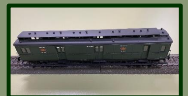
Slechts één van de vele wagons die bij Werkspoor werden gebouwd.

Méer dan bijzonder was de bijdrage die gebracht werd door de heer A. van der Lee: tientallen schaalmodellen van wagons en locomotieven zoals die ooit bij Werkspoor werden gebouwd. Letterlijk een waardevolle uitbreiding van de collectie.